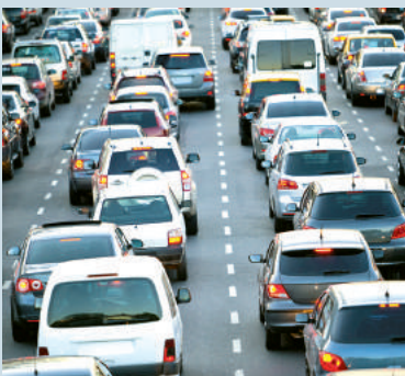
Es wird immer voller: Staulösungen nötig.