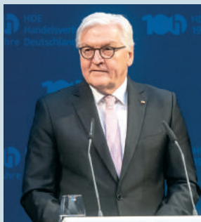
Laudatio: Bundespräsident Frank-Walter Steinmeier